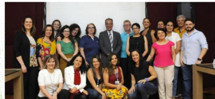
126. REUNIÃO ORDINÁRIA DO CONFOCO-RH ONDE NOVO PORTAL DAS PARCELIAS FOI LANÇADO

Em outubro de 2018 nova versão foi lançada, mais completa e acessível, resultado do esforço concentrado de um grupo de trabalho formado por servidores da Procuradoria-Geral do Município (PGM), da Prodel e da Subsecretaria de Comunicação Social. Esse diálogo com o órgão institucional da Prefeitura que cuida dos temas referentes a tecnologia é fundamental para os ajustes que são permanentemente necessários.