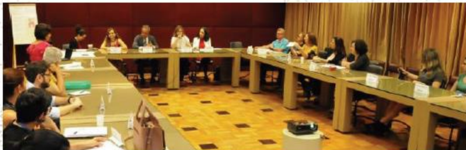
12ª REUNIÃO ORDINÁRIA DO CONFOCO-BH

A previsão da autorização legal para criação do respectivo Conselho não é suficiente para que os entes criem a instância, mas é uma conquista da sociedade civil organizada de induzir que a Administração Pública defina uma interlocução sobre o tema e seja porosa para admitir a participação dos particulares interessados. O planejamento das competências ajuda a definir o alcance das atribuições dos conselheiros e conselheiras.