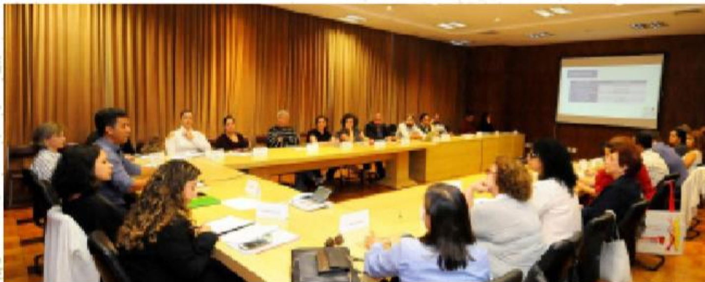
12ª REUNIÃO ORDINÁRIA DO CONFOCO-BH

Na redação da lei, há indução de articulação do Confoco com os conselhos setoriais de políticas públicas deixando claro que não tem hierarquia entre eles. O Confoco é a instância participativa que deve tratar prioritariamente da relação de parcerias entre o Município e as Organizações da Sociedade Civil. Nesse sentido, deve estar em contato com os demais conselhos quando tratar de pautas que os afetam diretamente.