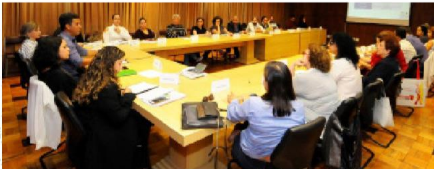
1ª REUNIÃO ORDINÁRIA DO CONFOCO-BH EM QUE O NOVO DECRETO FOI APRESENTADO.

O Decreto n.º 16.746/2017 como alicerce legal local garante à Belo Horizonte um modelo paradigmático de implementação da nova lei. Atua em uma importante frente para tornar o MROSC mais consolidado e perene: institucionaliza no Poder Executivo um ponto focal especializado de coordenação, articulação e apoio, com a definição de funções claras