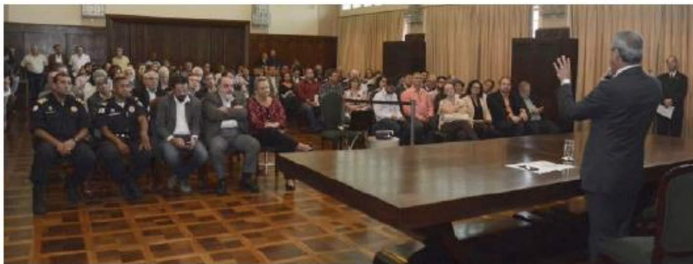
Reunião convocada pelo Prefeito em junho de 2017 para anunciar o projeto MROSC - BH.

Para iniciar o trabalho do MROSC em qualquer que seja o ente federado é necessário ter o comprometimento da alta gestão vocalizado em documentos e atos públicos correspondentes. O processo precisa acontecer com força institucional assertiva e uníssona, com o menor número de percalços típicos da resistência ao novo. A implementação de um novo regime jurídico que muda a cultura na administração pública requer uma adequada instrumentalização para dotar os servidores e parceiros da sociedade civil de boas ferramentas de gestão. As ações devem vir acompanhadas de uma sensibilização permanente que precisa ser vocalizada de tempos em tempos pela alta cúpula para que seja respeitada por todos como diretriz institucional de governo, além de ser também uma clara política de estado conquistada por meio da edição da Lei n.º 13.019/2014.